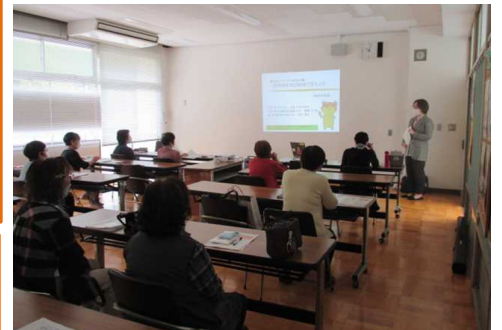
熱心に聞き入る受講者の皆さん

認知症とは… 脳は人間の活動をコントロールしている司令塔です。いろいろな原因で脳の細胞が死んでしまったり、脳の司令塔の働きに不都合が生じ、継続して日常生活動作に支障が出る状態のことです。